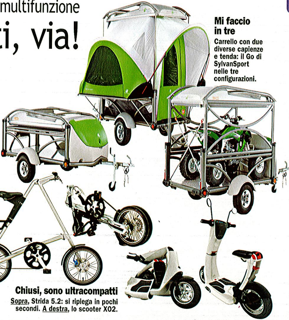
Mi faccio in tre Carrello con due diverse capienze e tenda: il Go di SylvanSport nelle tre configurazioni.