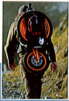
Bergmönch si porta come uno zaino in salita (sopra), si apre nella discesa.